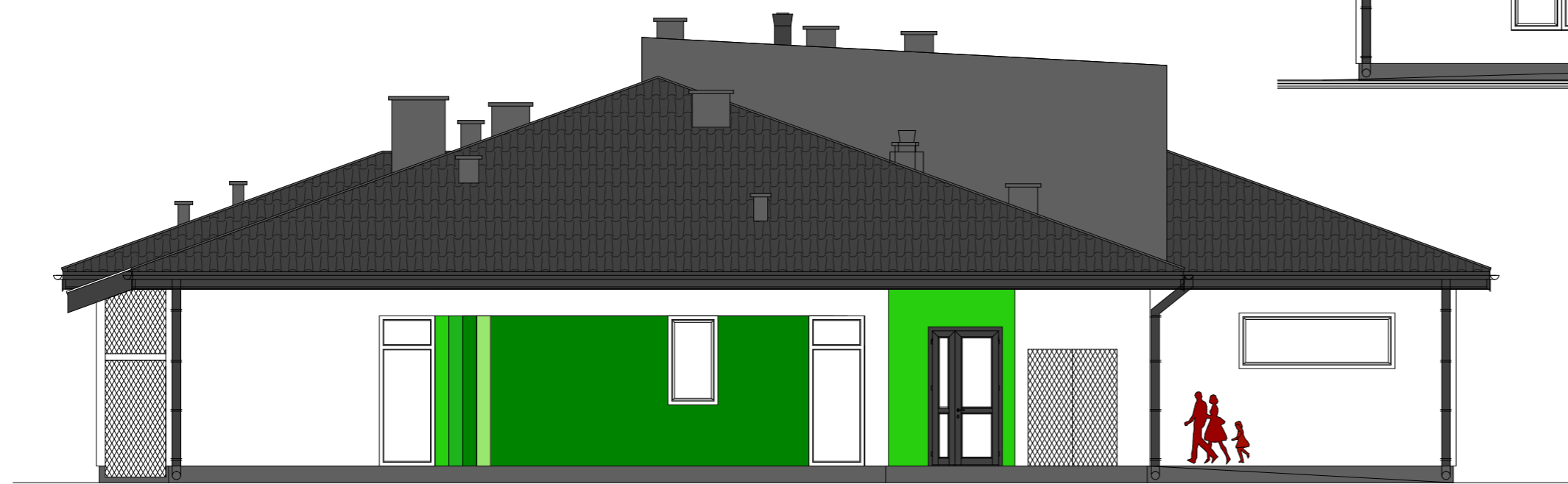
ELEWACJA BOCZNA WSCHODNIA 1: 100