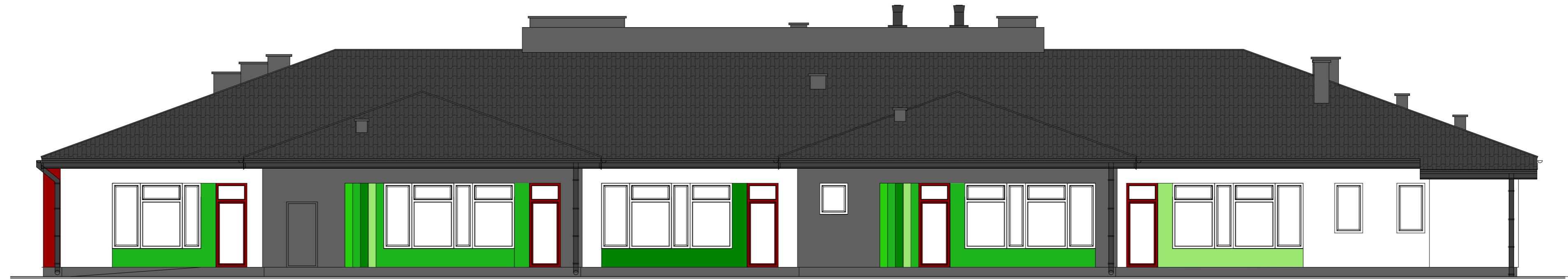
ELEWACJA TYLNA POŁUDNIOWA 1: 100