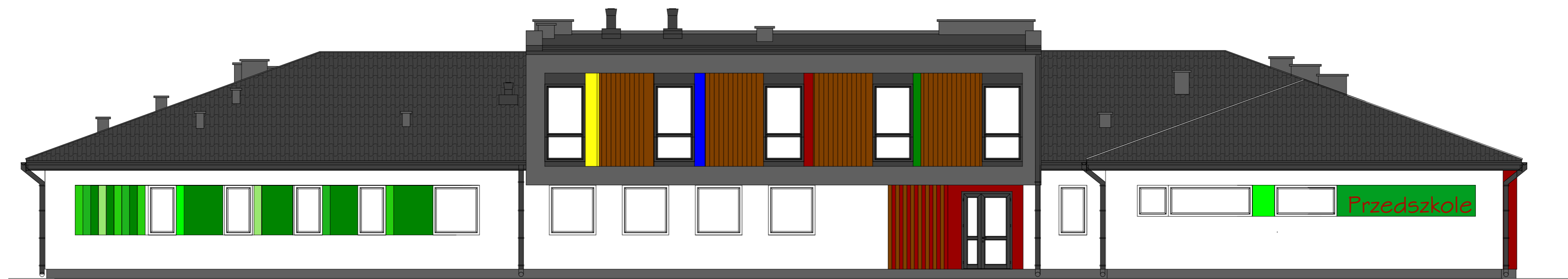
ELEWACJA FRONTOWA PÓŁNOCNA 1: 100