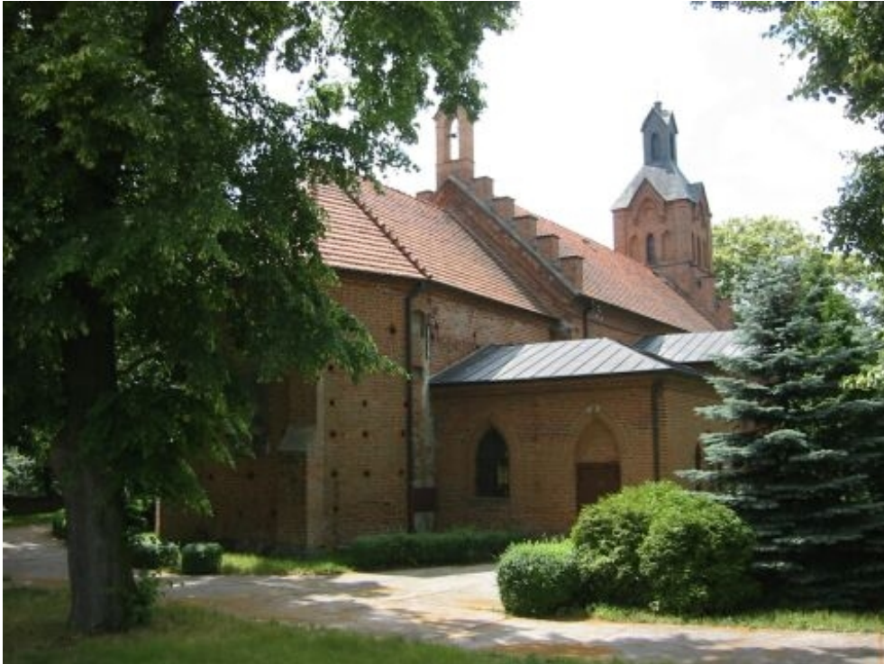
Kościół p.w. św. Jakuba Ap. w Piotrkowie Kujawskim