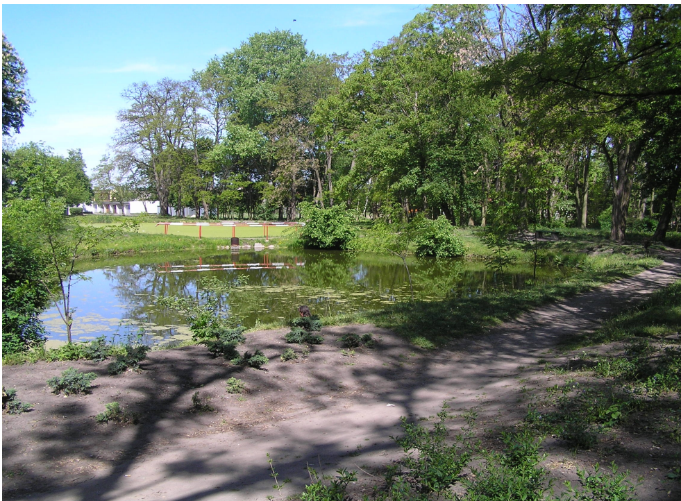
Zespół dworsko-parkowy w Piotrkowie Kujawskim